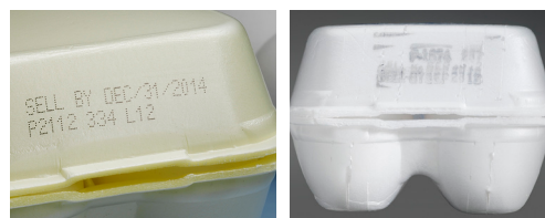
Inyección de tinta en un cartón de poliestireno

Las impresoras CIJ pueden avisar al usuario e incluso a la clasificadora en caso de posibles problemas que puedan dar lugar a códigos mal impresos. Dado que el cabezal de impresión nunca toca el cartón, las impresoras CIJ no son susceptibles de los errores de impresión más frecuentes de los dispositivos de codificación de contacto. Muchas impresoras de la serie 1000 de Videojet incorporan nuestros cabezales de impresión CleanFlow™, que están diseñados para reducir los errores de impresión asociados a cabezales de impresión sucios. Asimismo, el funcionamiento diario de las impresoras de la serie 1000 es más sencillo porque estas impresoras avisan de la falta de suministros, están diseñadas para que la carga de tinta sea sencilla y ayudan a impedir la aparición de problemas mediante el uso de las tintas adecuadas.